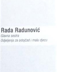
Rada Radunović Glavna sestra Odjeljenja za odočad i malu djecu