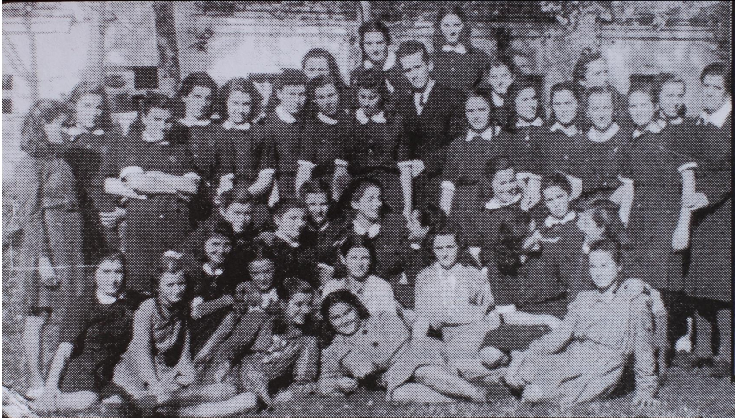
Prva generacija završne godine Medicinske škole 1947/50 godine Cetinje